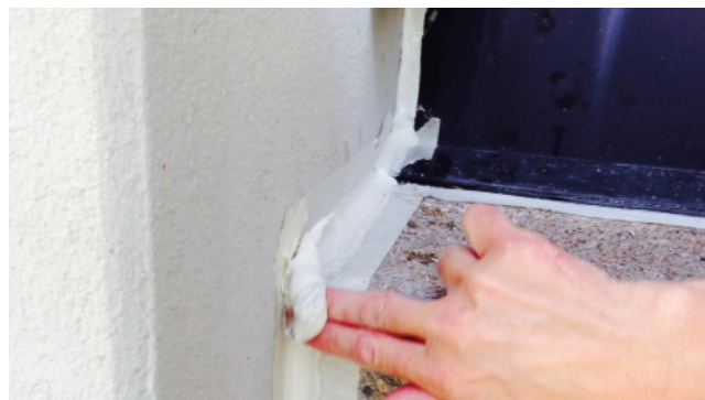
Alle Fugen müssen eine Neigung von mindestens 15° haben, damit Wasser leicht abfließen kann.

Es ist unabdingbar, dass die Fugenoberfläche eine möglichst glatte Oberfläche aufweist, auf der sich der Schmutz nicht ansammeln kann.