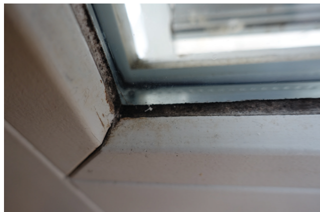
Für die Besiedelung von Schimmel sind hohe Feuchtigkeit und Nährstoffe Voraussetzung. Anfällige Stellen sind Fenster oder Badezimmer.

Schimmelpilze vermehren sich meist ungeschlechtlich über die sogenannte Sporulation, dies bedeutet; sie bilden winzig kleine, wenigzellige behütete Kapseln aus, welche später wieder zu neuen Schimmelpilzen heranwachsen werden. Schimmelpilzsporen sind extrem widerstandsfähig und resistent, sie können ihren Stoffwechsel herunter fahren und benötigen durch dies weder Nährstoffe, Wasser noch Sauerstoff. Durch ihre sehr kleine Grösse von gerade einmal nur 0.01mm werden sie leicht durch den Wind oder Luftzüge im Hausinneren verbreitet. Wenn die